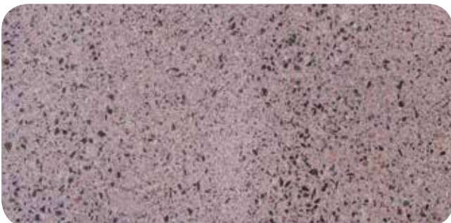
weberfloor 4635 Design Grinded Stone innehåller mörka hårdballastkorn med max kornstorlek 3 mm. Genom att slipa ytan kan man få dessa att framträda mot den ljusare bakgrunden.

Weber har därför tagit fram två produktserier för publika golv, en med genomfärgade avjämningsmassor som finns i tio kulörer, Design Colour, och en med specialballast med större mörkare ballastkorn där avjämningsmassan slipas så att ballastkornen framträder i en terazzoliknande yta, Design Grinded Stone. Den sistnämnda finns att tillgå i fyra bakgrundskulörer.